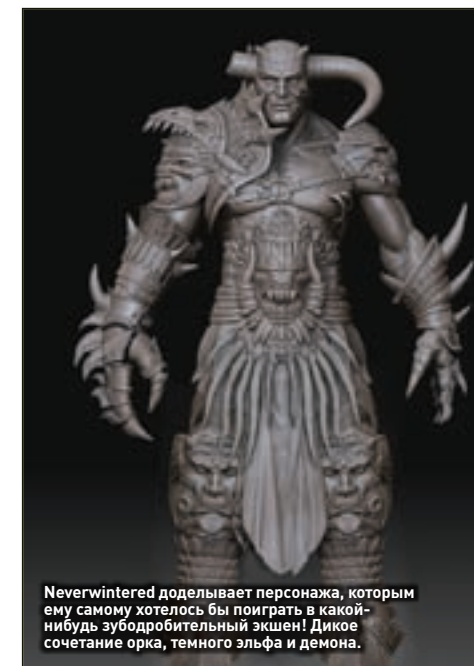
Neverwintered доделывает персонажа, которым ему самому хотелось бы поиграть в какой-нибудь зубодробительный экшен! Дикое сочетание орка, темного эльфа и демона.