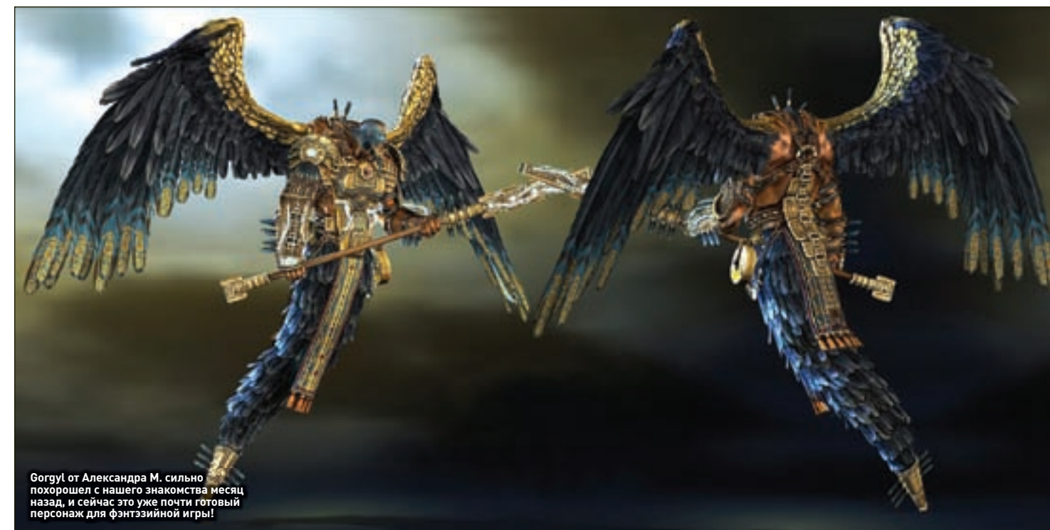
Gorgy! от Александра М. сильно похорошел с нашего знакомства месяц назад, и сейчас это уже почти готовый персонаж для фэнтезийной игры!

сайт конкурса, где ты можешь посмотреть все: www.dominancewar.com . Ознакомившись с работами конкурсантов, можно вздохнуть спокойно – несмотря на пространственное мнение, что свежие идеи сейчас не в моде, что все новое – это хорошо забытое старое и плагиат и клоны поглотили игровую индустрию, мы отчетливо видим, сколько всего нового и необычного еще не сказано и не создано. Прекрасных персонажи, свежие идеи, интересные сюжетные истории, а также те люди, которые их создают, есть и в мире в целом, и в России в частности. Уверен, о многих из них мы услышим не раз и уж точно увидим их работы на страницах «РС ИГР» и на экранах наших мониторов в будущих играх! РГ